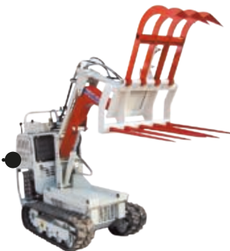
WIDŁY ZE SZCZYPCAMI